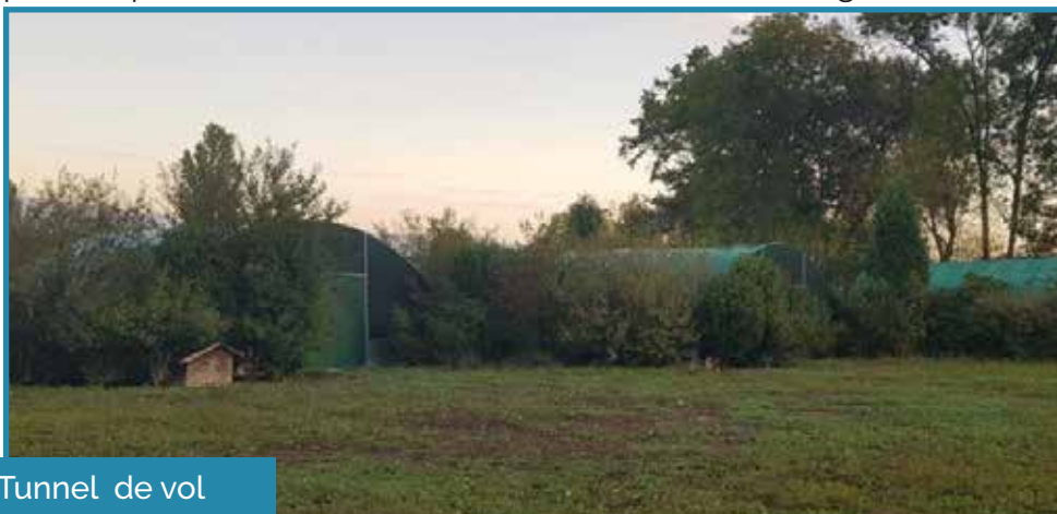
Tunnel de vol

Le Centre de Réadaptation des Rapaces repose principalement sur le travail d'une équipe de bénévoles motivés, de personnes placées par l'Hospice Général ainsi que de stagiaires. Il œuvre en collaboration avec les services vétérinaires, les autorités locales, les pompiers, la police municipale, les gardes-faune, SOS hérisson, le CCO, la SPA et d'autres organismes œuvrant pour la protection des animaux de la faune sauvage.