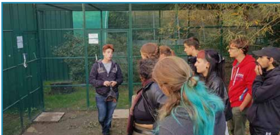
Visite du CRR par l'une de nos bénévoles.

Durant les visites, le fonctionnement du centre est expliqué. Les visiteurs suivent les bénévoles à travers le parc, les tunnels de vol et les volières où se trouvent les rapaces non relâchables. L'aspect pédagogique est également mis en avant grâce aux présentations d'animaux organisées sur le site, permettant ainsi de sensibiliser un large public au monde fascinant des oiseaux. D'autre part, le CRR participe à diverses manifestations locales afin d'aller à la rencontre du public et de faire connaître son action.