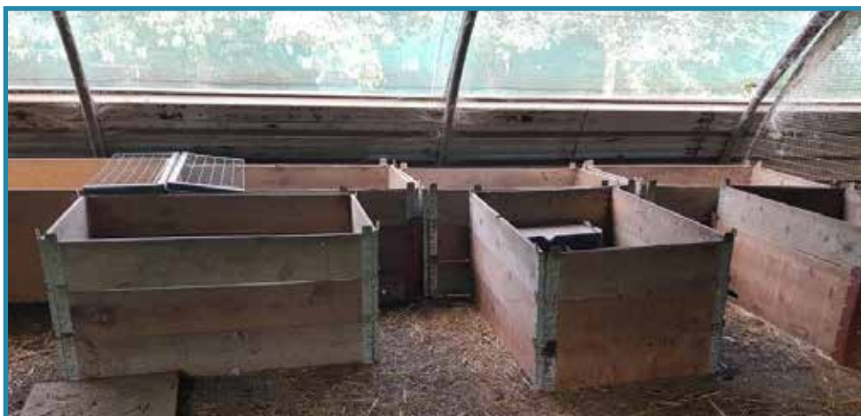
Les boîtes à hérissons.

14 boîtes de plus d'un mètre carré sont installés pour recevoir des hérissons, ainsi que 2 boîtes de 2m50 de long et de large et deux volières avec de la végétation.